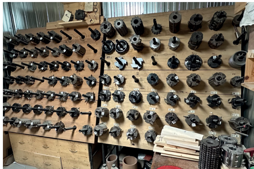
Collection de têtes à couteaux de moulurières.

La taille de l'entreprise, l'expertise des patrons, la fiabilité de leurs équipes font en sorte que TremTech est assez petite pour considérer les projets les plus personnalisés et ponctuels. Mais elle est aussi assez grande pour envisager les productions de la plus grande ampleur et récurrence.