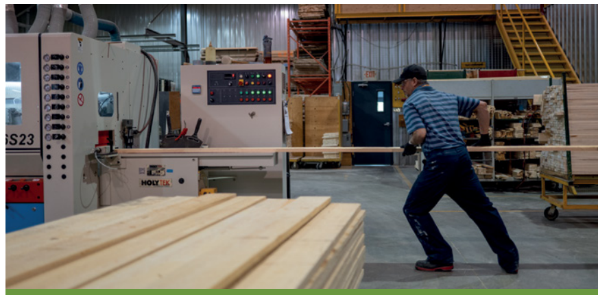
TremTech emploie crussi du pin rouge sélect, comme on le voit ici.

« Pendant plus de dix ans, j'étais dans le cercueil avec mon père. »